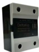
Однофазное твердотельное реле DK1-HDH6044.ZD3

Количество фаз: однофазное Тип нагрузки: резистивная/ индуктивная Управляющий сигнал: 3..32VDC Диапазон коммутируемого напряжения: 40..440В переменного тока Максимальное пиковое напряжение: 9 класс (900VAC) Ряд номинальных токов реле: 60А